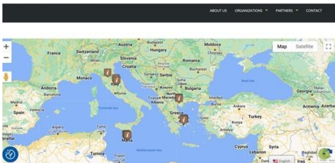
Immagine 1: La mappa creata all'interno della piattaforma, in cui è possibile accedere a diverse attività di giardinaggio urbano che si svolgono a Malta, in Grecia e in Italia.

Nella prima sezione del PR 1, ogni partner ha dovuto guardarsi intorno nelle proprie comunità e scoprire quali iniziative relative all'agricoltura urbana esistono già nelle loro aree e all'interno delle loro comunità. I risultati e le iniziative trovate sono stati poi inseriti nella mappa che si può consultare sulla piattaforma che abbiamo creato.